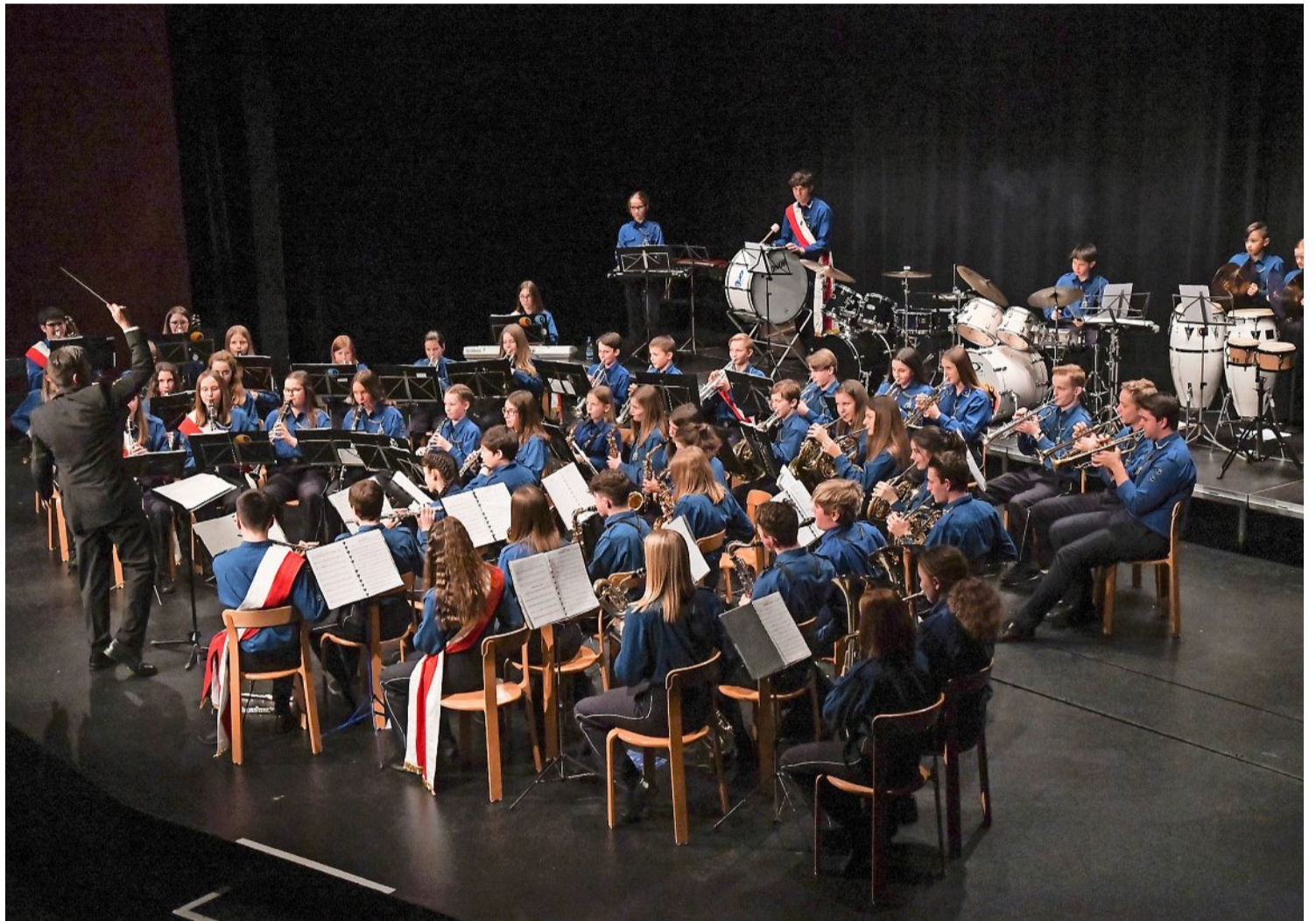
Die Thuner Kadetten bei ihrem Konzert im Schadausaal.

Nicht nur optisch machten die Jüngsten in ihren roten Fulehung-T-Shirts Freude. Stolz am Auftritt und Spielfreude kamen deutlich zum Ausdruck. Mit Boogie-Woogie-Klängen und südamerikanischen Elementen wussten sie zu gefallen. Besonders der witzige Einsatz als Kü-