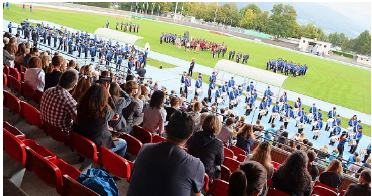
Gegen 500 Personen beobachteten das Prozedere im Lachenstadion von der Tribüne aus.